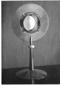
Monstranz, Messing versilbert, Elfenbeinnodus Lunula, Silber vergoldet Fritz Schwerdt und Will Plum, Aachen Ortensoire, Irlan argenté, ivoire-nodus, argenté, lunula, doré